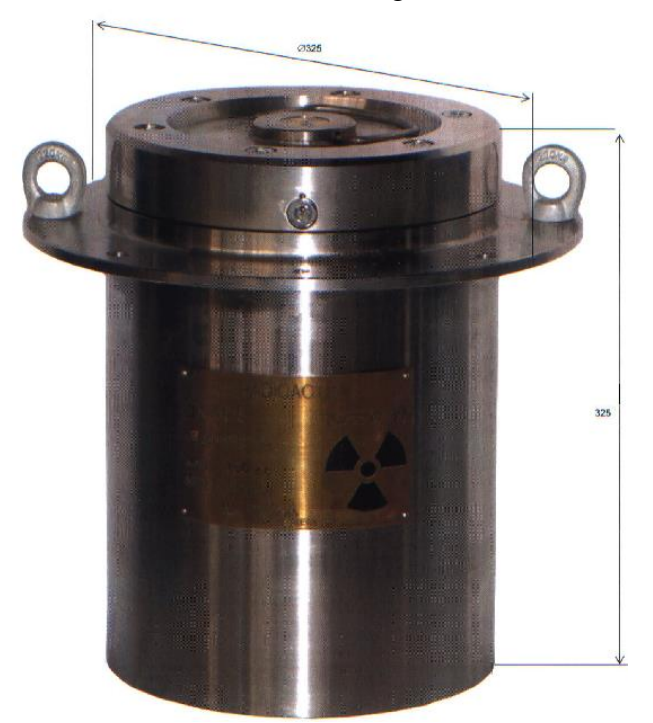
Illustration of shielding container