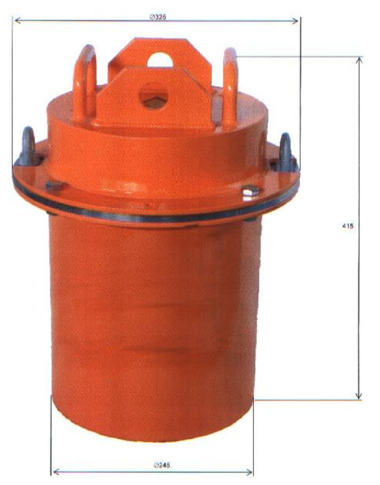
Illustration of transport container